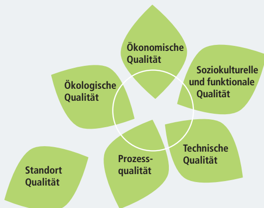
Die sechs Themenfelder des DGNB Zertifikats

Als übersichtliches und leicht verständliches Ratingsystem deckt das DGNB Zertifikat alle relevanten Felder des nachhaltigen Bauens ab und zeichnet herausragende Gebäude in den Kategorien Gold, Silber und Bronze aus. Sechs Themenfelder fließen in die Bewertung ein: Ökologie, Ökonomie, soziokulturelle und funktionale Aspekte, Technik, Prozesse und der Standort. Der Standort wird separat ausgewiesen.